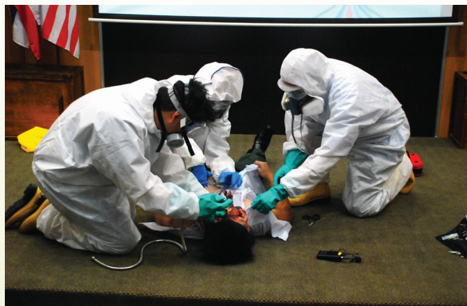
YBhg Tan Sri Datuk Seri Lee Lam Thye (right) as part of the gimmick launching for World Day for Safety and Health at Work 2014

The celebration of the World Day for Safety and Health at Work is an integral part of the Global Strategy on Occupational Safety and Health of the ILO and promotes the creation of a global preventative safety and health culture involving all stakeholders. In many parts of the world, national authorities, trade unions, employers' organizations and safety and health practitioners organize activities to celebrate this date. We invite you to join us in celebrating this significant day and share with us the activities you organize.