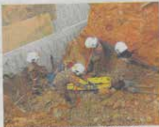
ANGGOTA bomba mengeluarkan mangsa yang dihempap konkrit selepas sebuah jambatan yang dalam pembinaan runtuh di Jalan Pengarang ke Sungai Rengit, Kota Tinggi semalam.