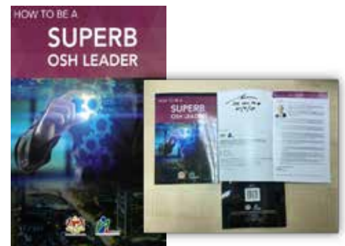
Rajah 2: Gambar Muka Depan, Tandatangan Pengerusi NIOSH dan Nombor Terbitan

Sementara itu, Pengarah Eksekutif NIOSH, En. Ayop Salleh dalam kata pengantar buku ini menyatakan bahawa ia merupakan rujukan yang baik untuk majikan di pelbagai industri di Malaysia yang berminat melaksanakan amalan OSH terbaik di tempat kerja mereka. Di samping itu juga, penerbitan ini adalah sejajar dengan peranan NIOSH yang menyediakan latihan, perundingan, penyebaran maklumat dan perkhidmatan penyelidikan serta pembangunan. Penerbitan maklumat OSH adalah salah satu fungsi NIOSH dan objektif utama buku panduan ini adalah untuk menggalakkan majikan untuk memiliki dan mengamalkan kepimpinan OSH yang cemerlang di tempat kerja mereka supaya kemalangan sifar dapat dicapai sementara produktiviti dapat ditingkatkan. Tambahan pula, penerbitan ini juga bertujuan untuk